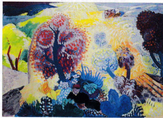
Isaac Grünewald, I fantasins värld ca 1915