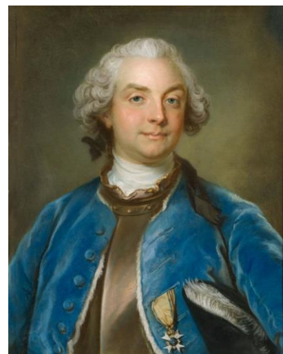
Axel von Fersen

Slottets historia var ytterst annorlunda även under 1940-talets krigsår, även här internationellt.